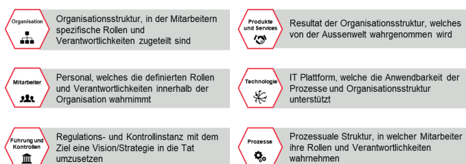
Bausteine der Transformation des Betriebsmodells